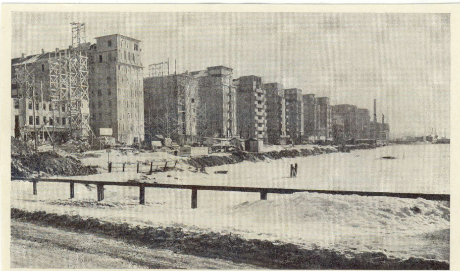
Fig. 39. Den västra delen av Norr Mälarstrand håller på att färdigställas med likartat utformade lamellhus. Det vackra läget har här utnyttjats på ett rationellt sätt. Mellan byggnaderna skola anläggas parker, som komma att underhållas av staden. Foto O. Ekberg 1931.