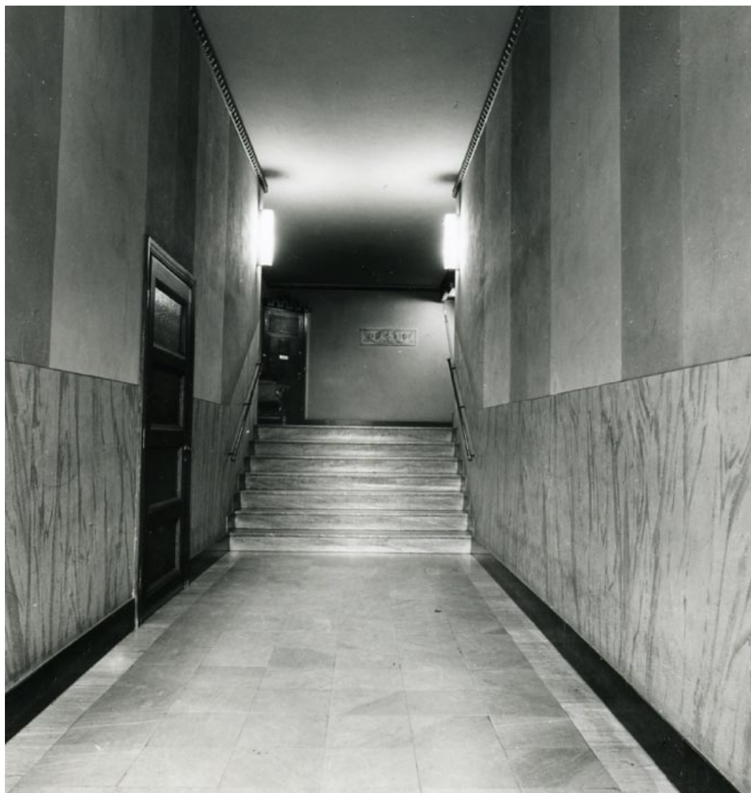
Entrén Norr Mälarstrand 70 just innanför stora porten, 1983