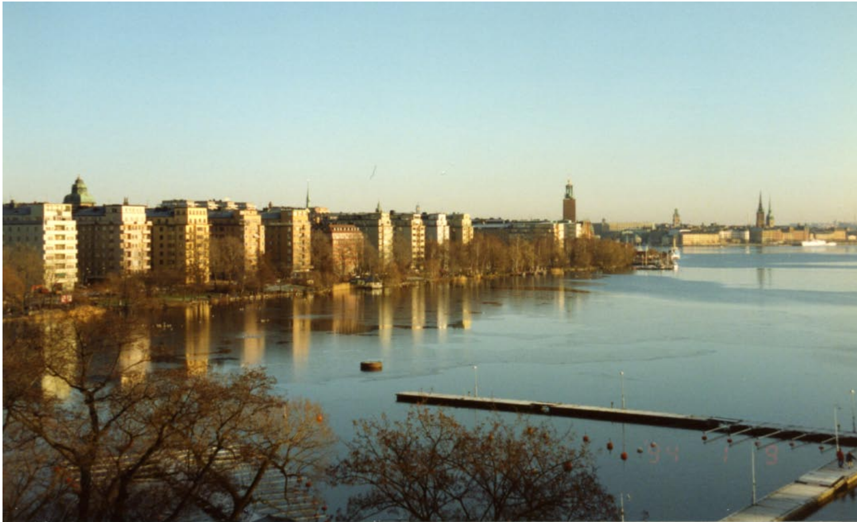
Norr Mälarstrand och Gamla Stan, 1994.