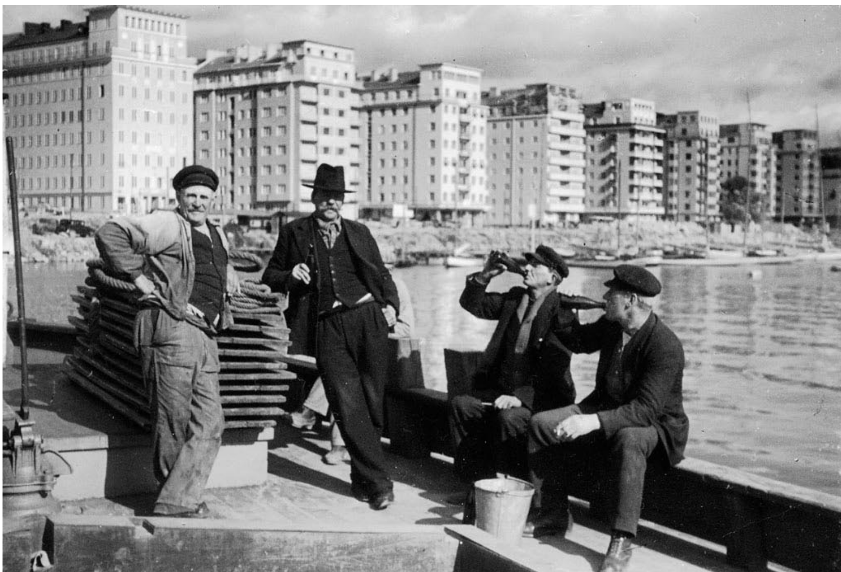
Ölande gubbar. Foto G.Lund, 1931