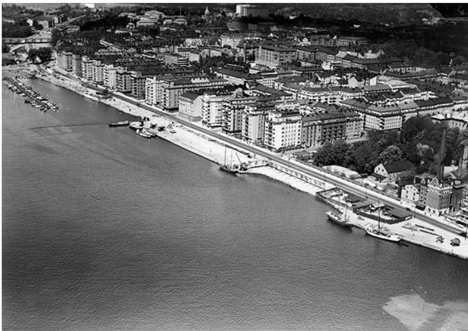
Flygfoto Norr Mälärstrand västerut, ca 1932.