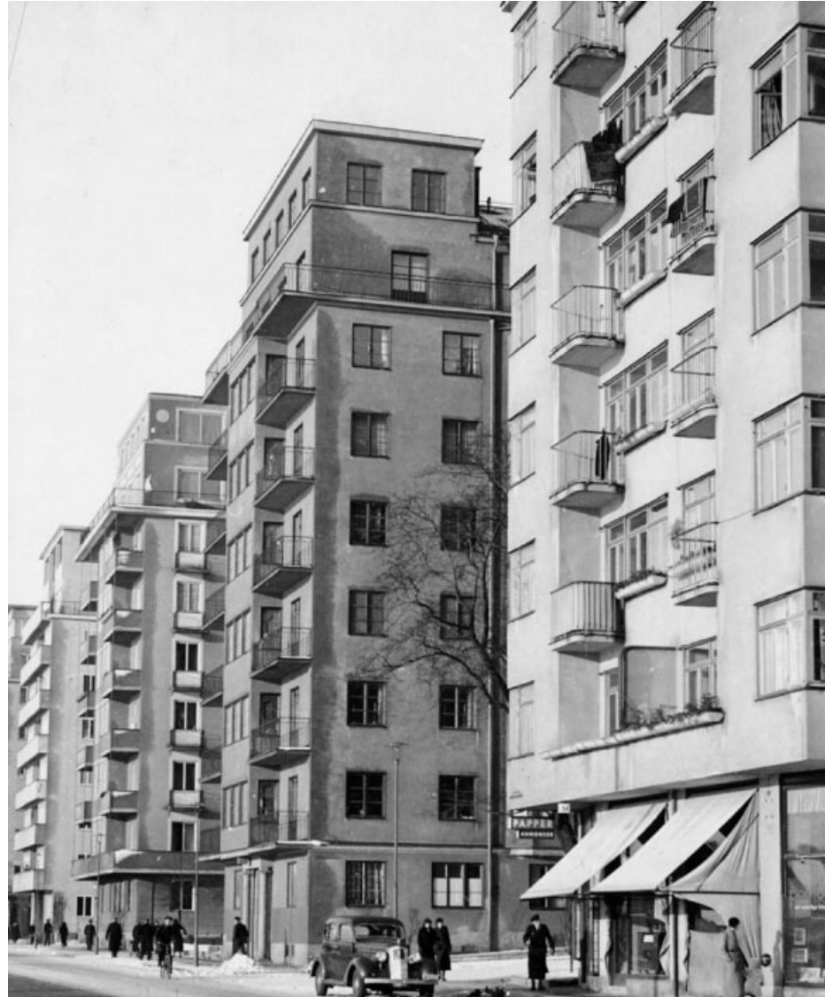
Norr Mälarstrand 64 och västerut. Fotograf J. Söderberg, 1936