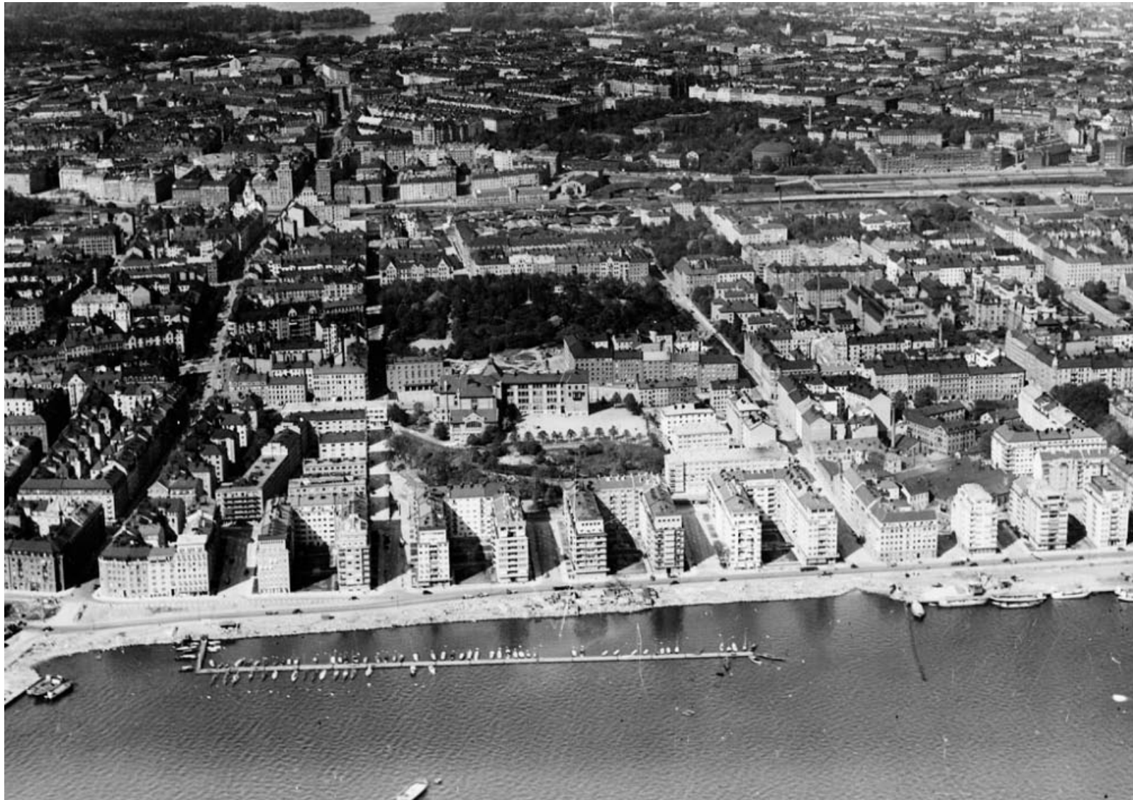
Norr Mälarstrand norrut. Flygfoto O. Bladh, 1932