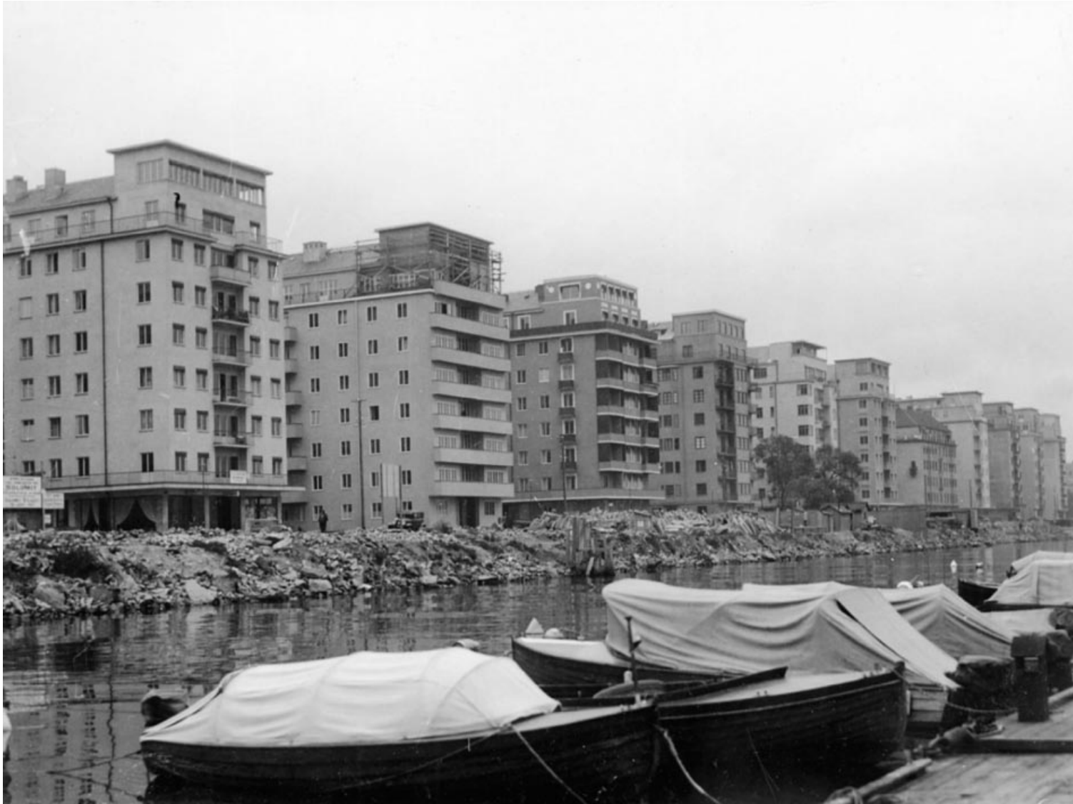
Norr Mälarstrand under byggnad. Bild för reportage i Stockholms Tidningen och Stockholms Dagblad, 1931