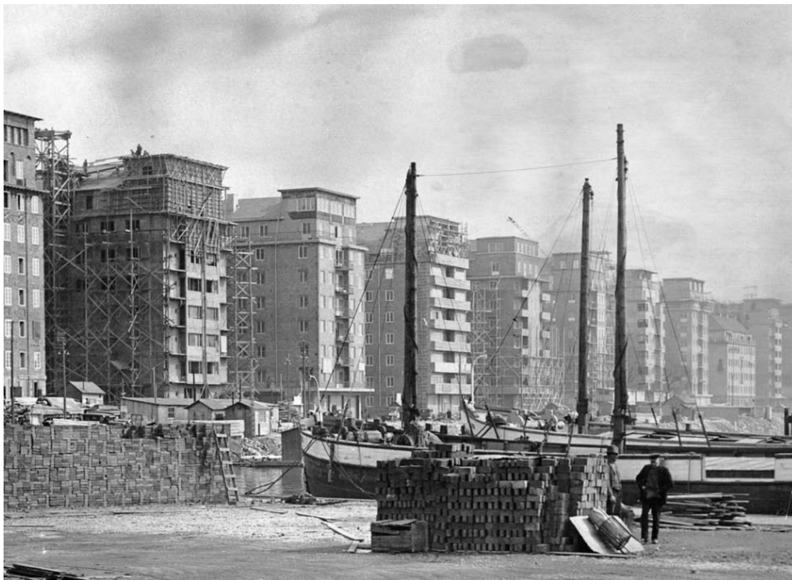
Husen på Norr Mälärstrand färdigställt. Bild tagen för Stockholms Dagblad sensommaren 1930