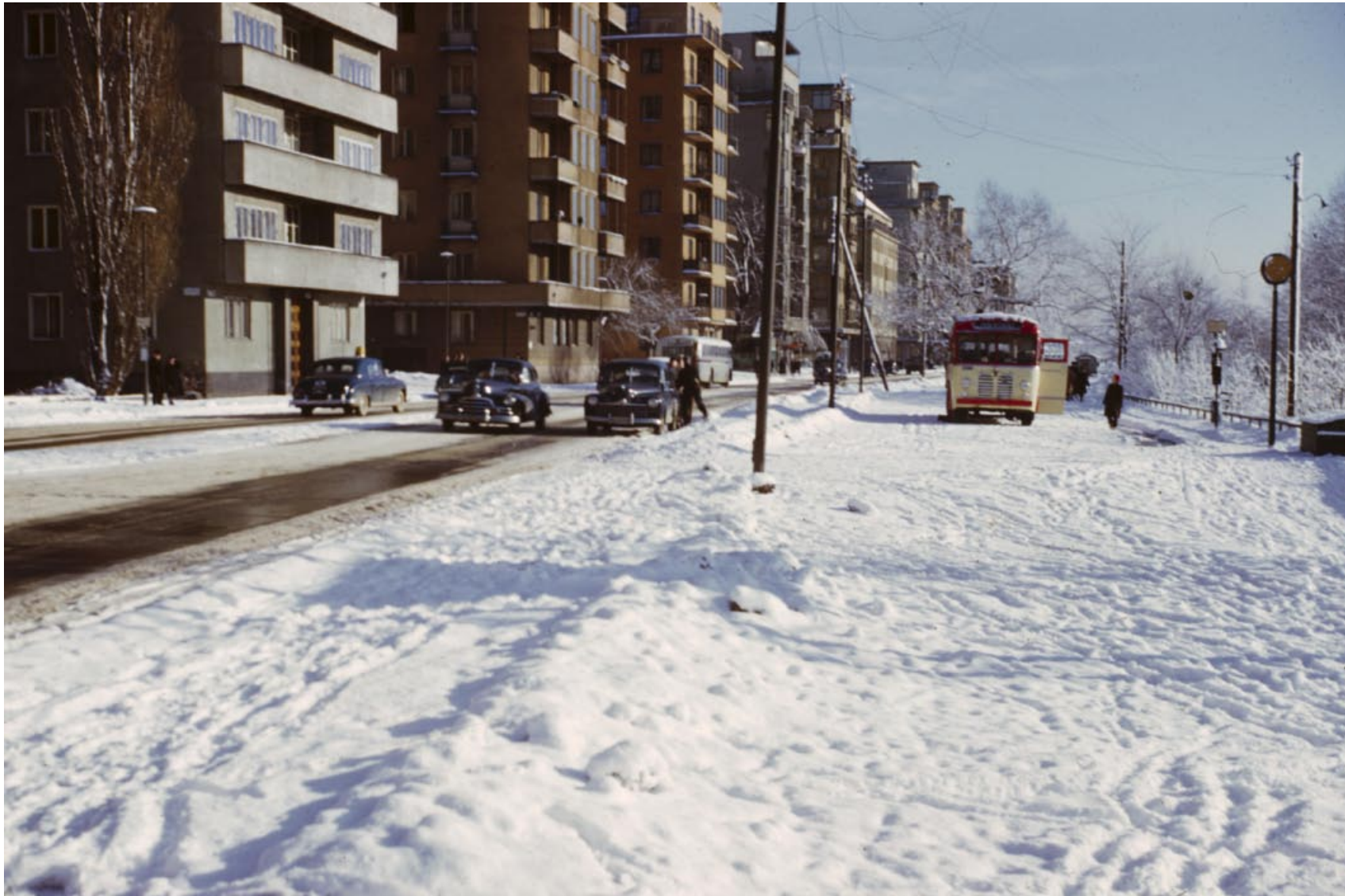
Norr Mälarstrand österut. Foto Gustav Cronquist, 1956