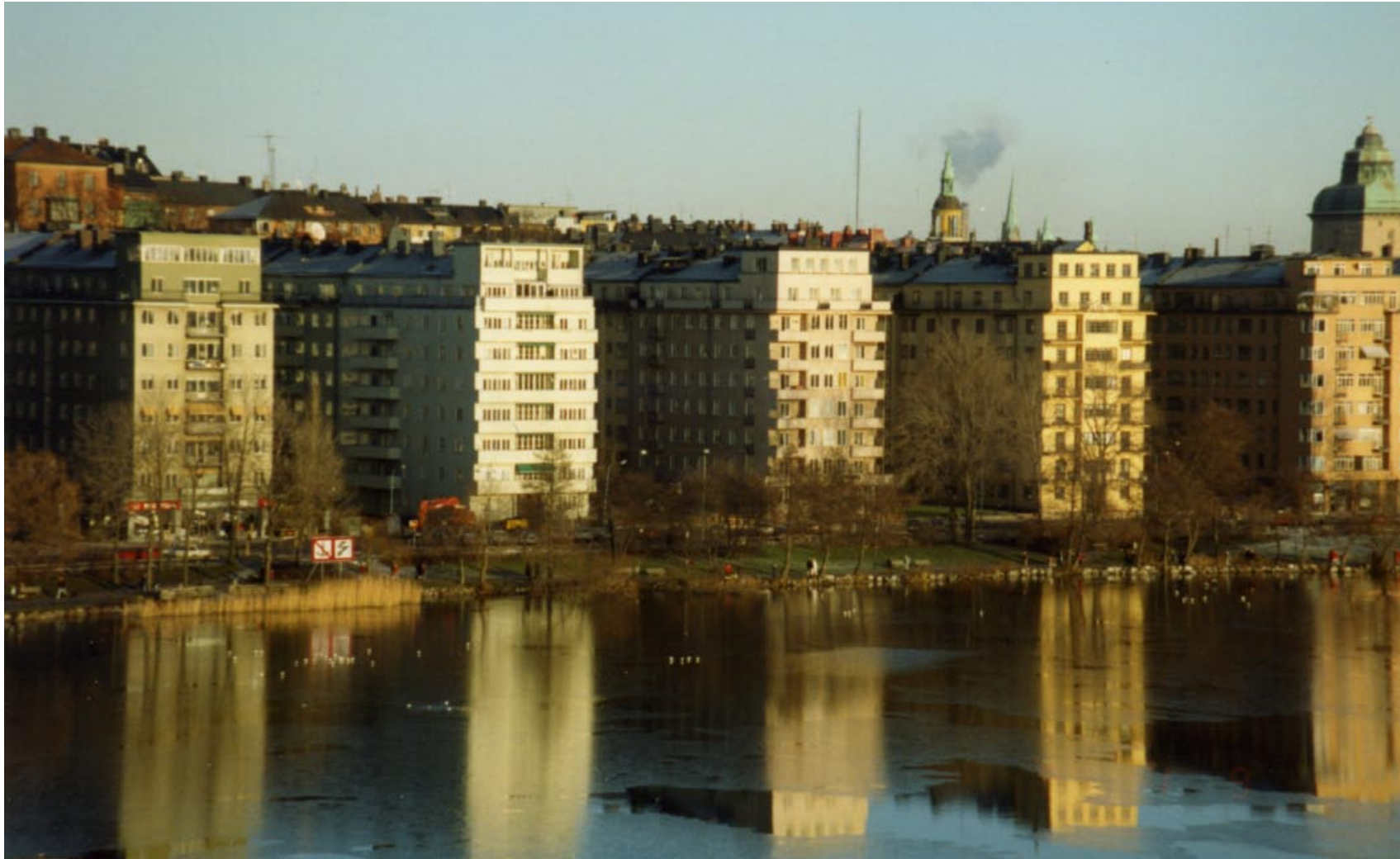
Norr Mälarstrand den 9 januari 1994.