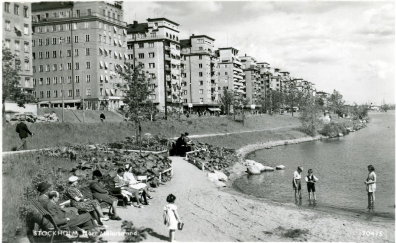
Norr Mälarstrand, c:a 1950