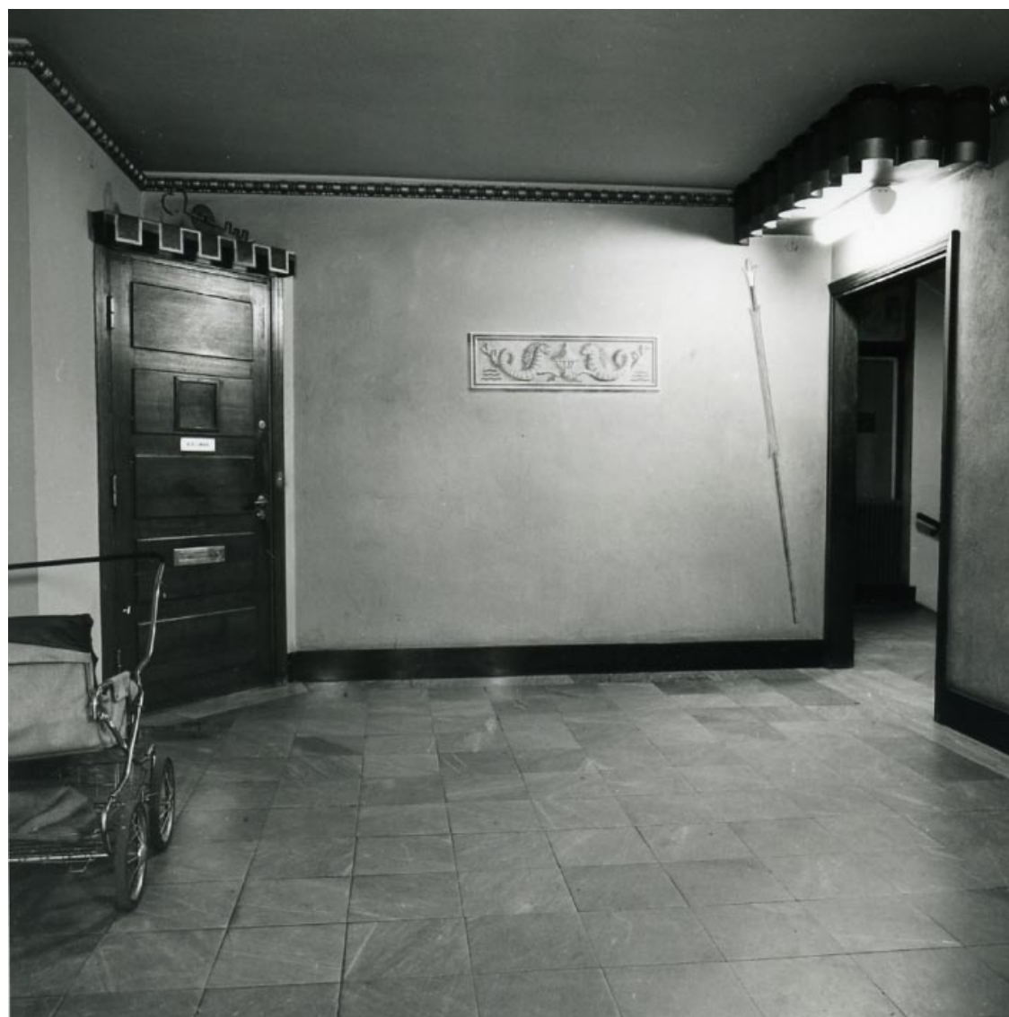
Portvaktsdörren på Norr Mälarstrand 70 med dekor i form av en stor nyckel.