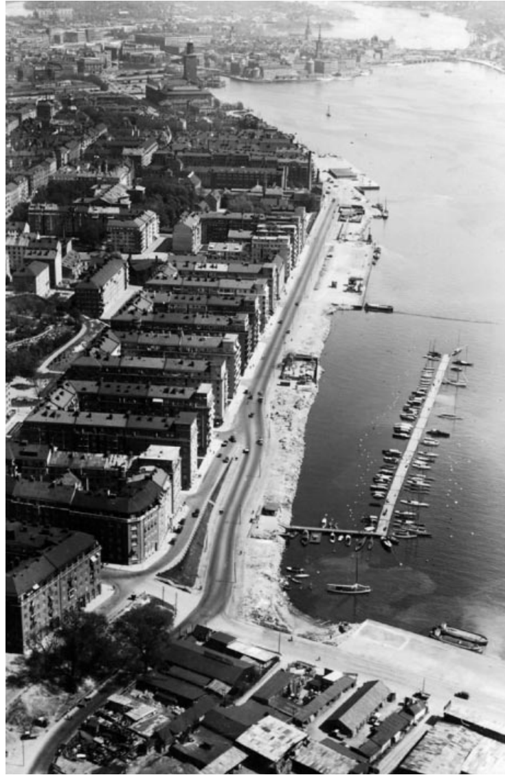
Norr Mälärstrand Österut mot Gamla Stan. Fotograf O. Bladh, 1932