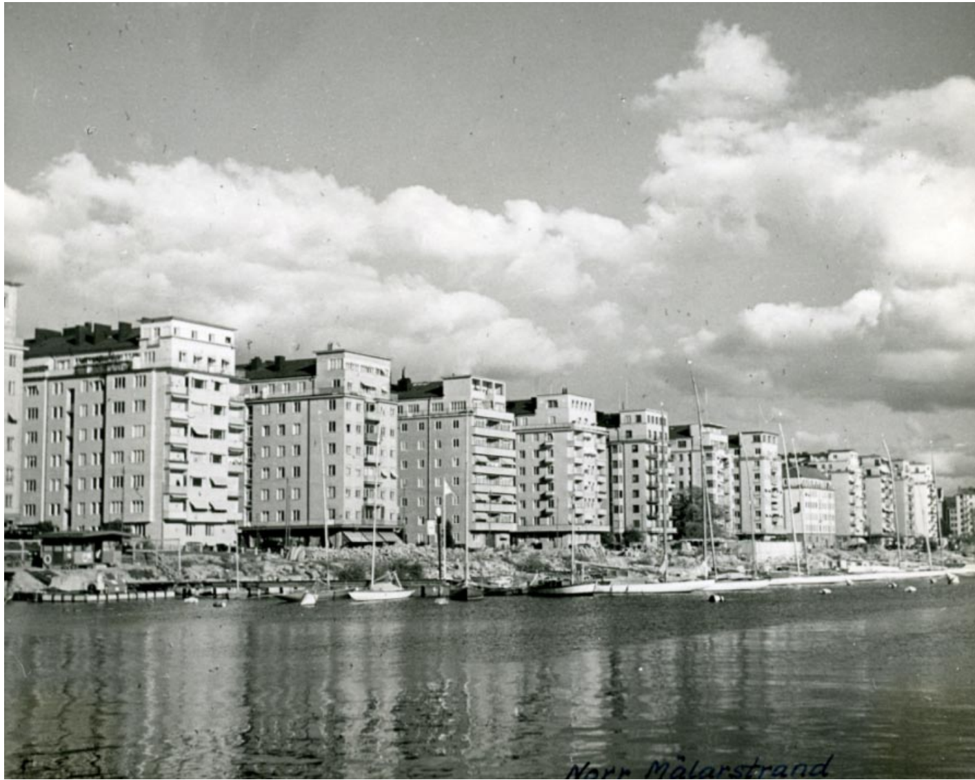
Norr Mälarstrand, c:a 1932