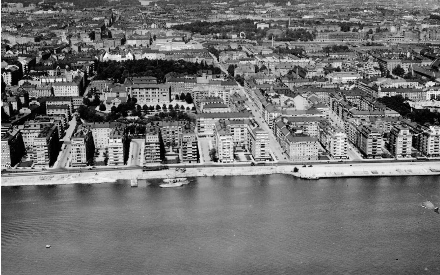
Norr Mälarstrand norrut. Fotograf O. Bladh, 1939